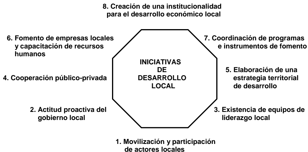
Gráfico 6: Bases de sustentación de las iniciativas de desarrollo local

Como vemos, se resalta en primer lugar, la importancia de la movilización y participación de los actores locales y la consiguiente construcción de “capital social” en el territorio correspondiente lo cual requiere, igualmente, el fomento de una cultura emprendedora local, alejada de la lógica del subsidio.