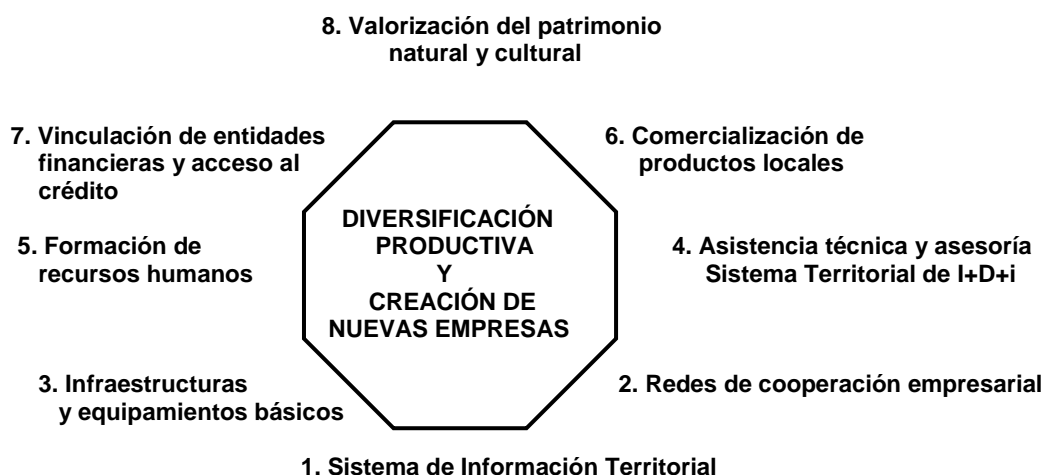
Gráfico 7: Ámbitos principales de actuación de las iniciativas locales de desarrollo

Con anterioridad se expuso gráficamente el conjunto de elementos necesarios para crear o impulsar iniciativas de desarrollo local. Mediante el Gráfico 7 se muestran ahora los ámbitos principales de actuación de las mismas.